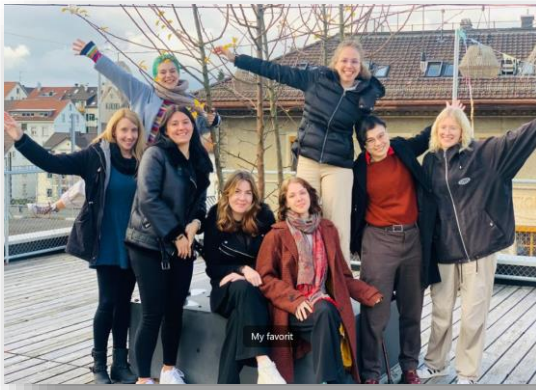
Die Gruppe young dementia carer an einem Treffen im November 2022 auf dem Lattich - Dach.

Seit 2021 vernetzen und begleiten wir Jugendliche und junge Erwachsene, welche eine Mutter oder einen Vater haben, die/der jung an Demenz erkrankt ist. Diese Gruppe durfte im vergangenen Jahr wachsen und trifft sich mehrmals pro Jahr physisch oder online. Der gegenseitige Austausch mit Gleichbetroffenen und das verstehende Zusammen-Sein hilft den jungen Angehörigen, das Krankheitsgeschehen und die Situation zu Hause zu bewältigen, und das unendlich schwierige Schicksal zu tragen.