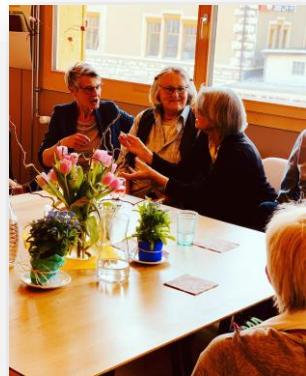
Regel Austausch am mosa!k Frühlingscafe 2022

! Im März luden wir zum mosa!k Frühlings-Café in den Lattich ein. Man konnte unsere Räumlichkeiten besichtigen, bekam Informationen zu den verschiedenen Angeboten und es standen Getränke und kleine, feine Häppchen zum Geniessen zur Verfügung. Wir durften uns über ein volles Haus freuen. Zahlreichen Gäste besuchten uns und es gab viele schöne Begegnungen und Gespräche.