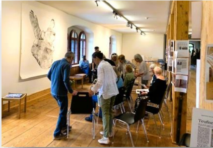
Unsere Gäste und Freiwilligen nehmen im Zeughaus Teufen Platz vor dem Werk, welchem eine kreative Geschichte entlockt werden soll.

Im vergangenen Jahr wurden die mosaik – Museumsangebote von der Steinegg Stiftung, Herisau und der Susanne und Martin Knechtli – Kradolfer Stiftung, St. Gallen unterstützt. An dieser Stelle ein herzliches Dankeschön für die grosszügige Unterstützung!