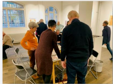
Im Museum im Lagerhaus wird jeweils aktiv und kreativ gearbeitet, immer nach dem Vorbild eines Werkes aus der aktuellen Ausstellung.