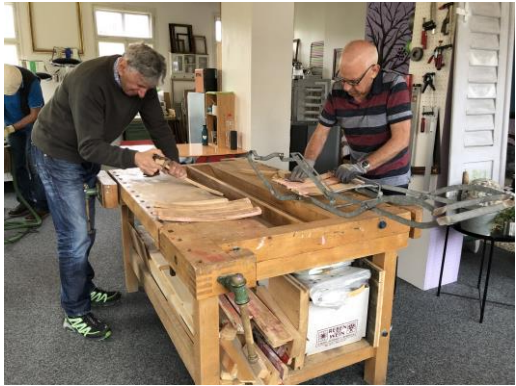
Einblick in die Juni-Werkstatt 2021

Mittagessen und eine Anreisebegleitung vom Bahnhof St. Gallen nach Trogen. Möglich geworden ist die Pilotphase dieses Angebotes mit der Hilfe mehrerer Sponsoren. Wir bedanken uns an dieser Stelle von Herzen bei der Gemeinde Trogen , der Gemeinde Speicher und der Stiftung SK Trogen 1821 .